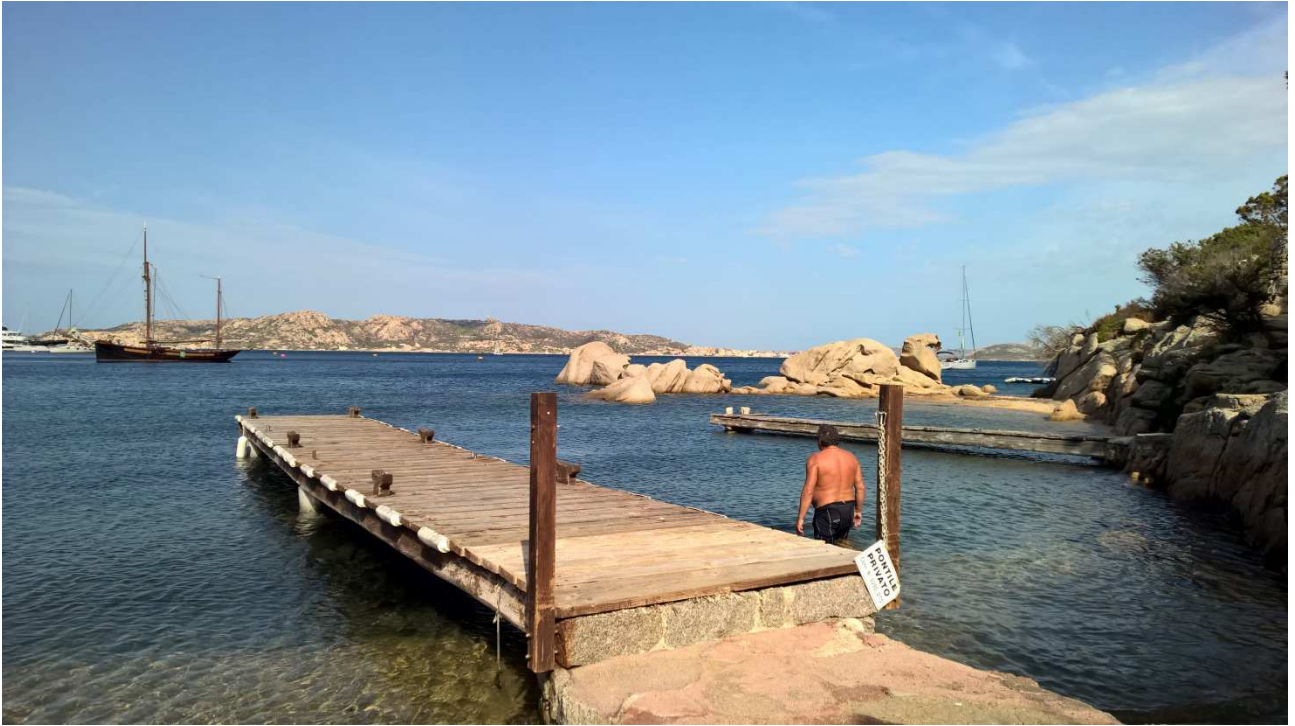
06/10/2015 Port Raphael ..... e Majur