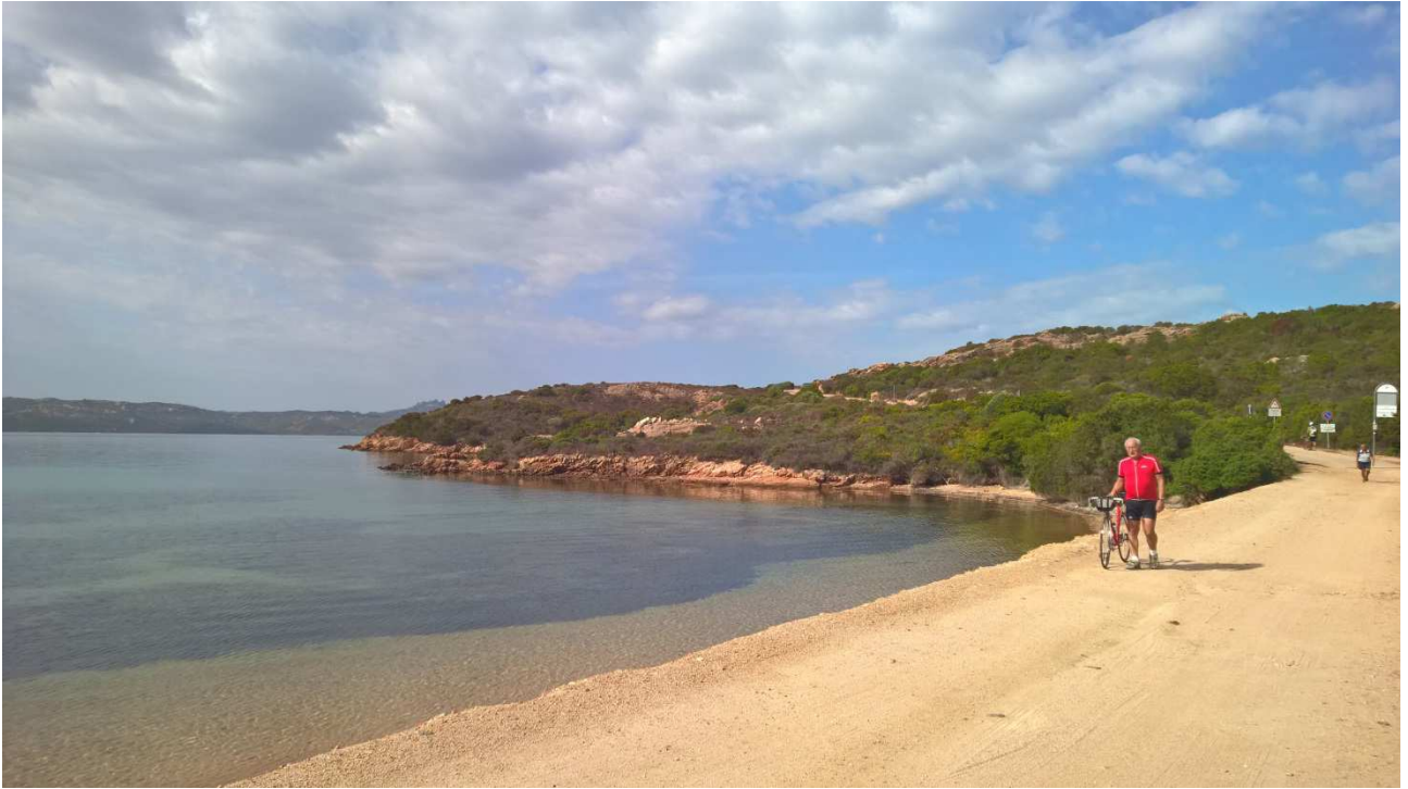
06/10/2015 Isola di Caprera ..... una delle sue spiagge ed una strada sterrata