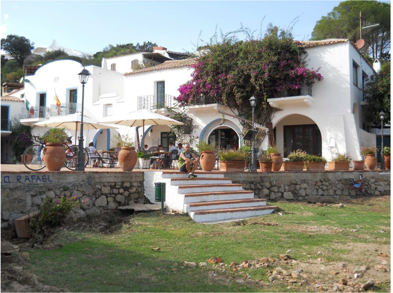
06/10/2015 Port Raphael