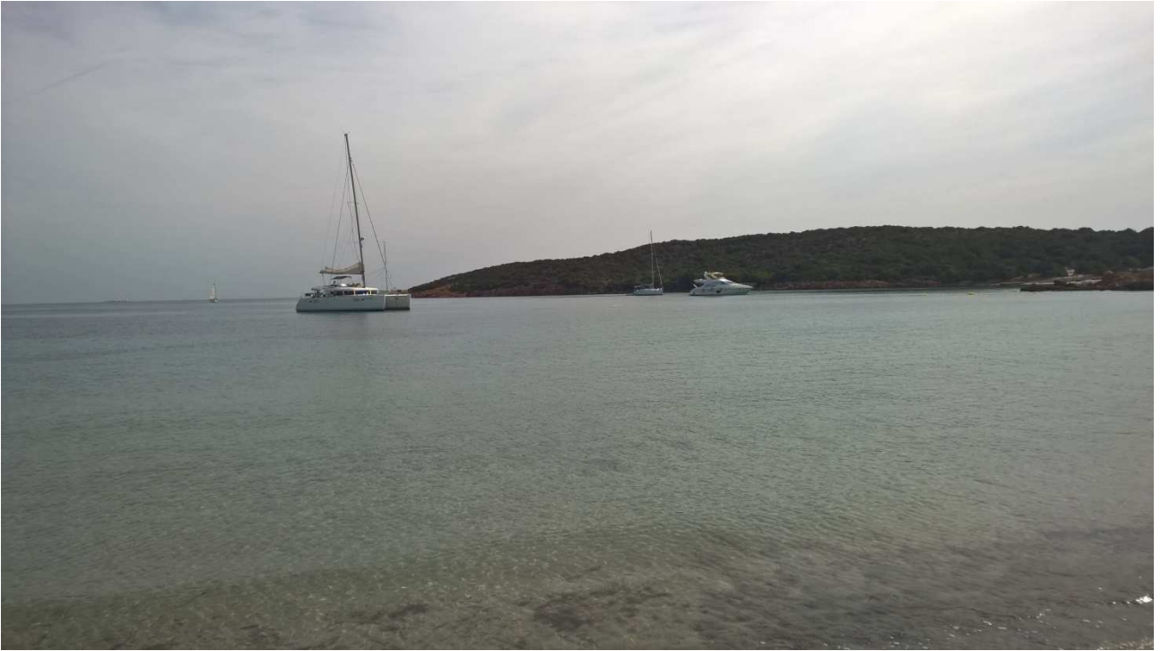
06/10/2015 Isola di Caprera ..... una delle sue spiagge