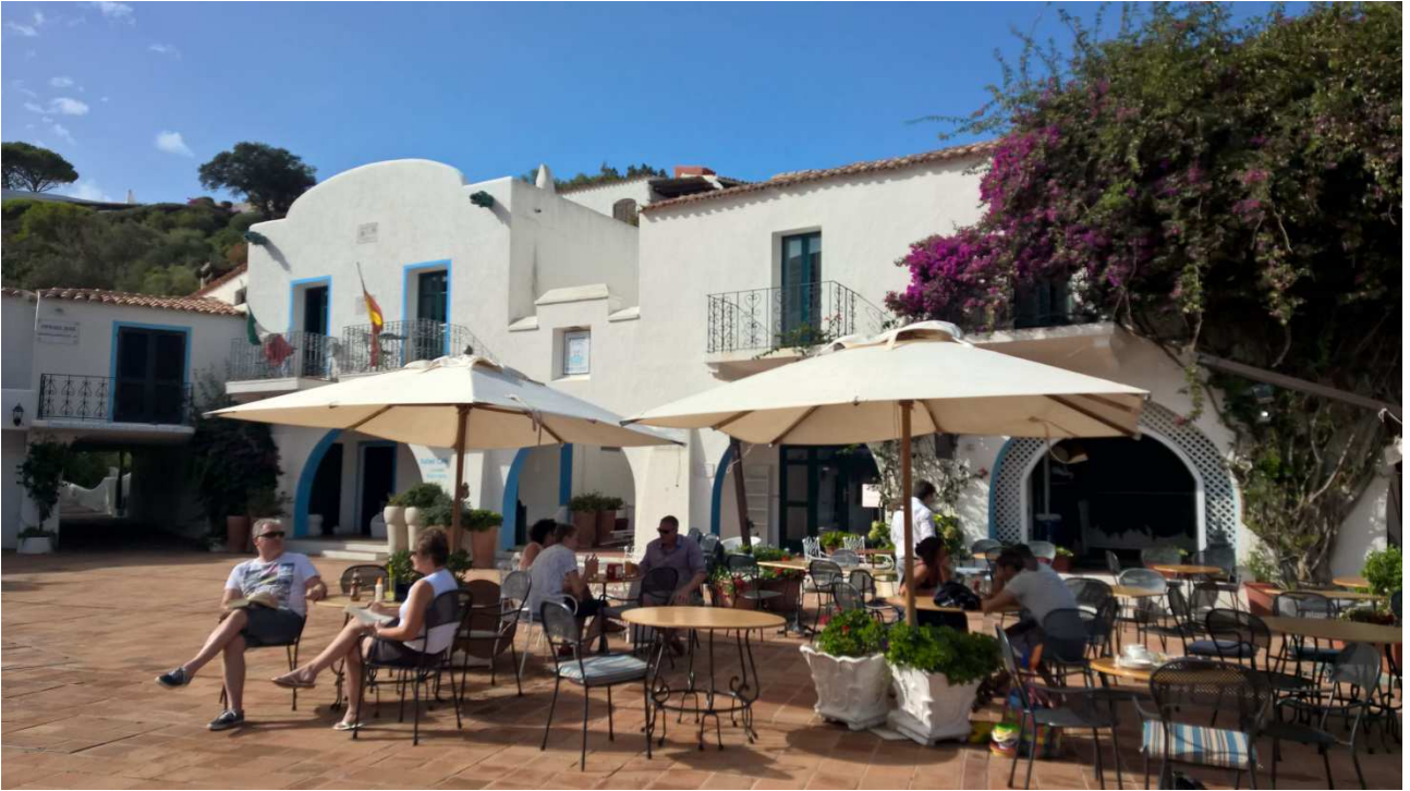
06/10/2015 Port Raphael