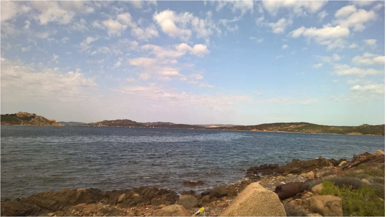
06/10/2015 Isola di Caprera ..... panorama