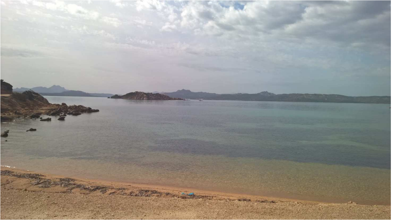
06/10/2015 Isola di Caprera ..... una delle sue spiagge