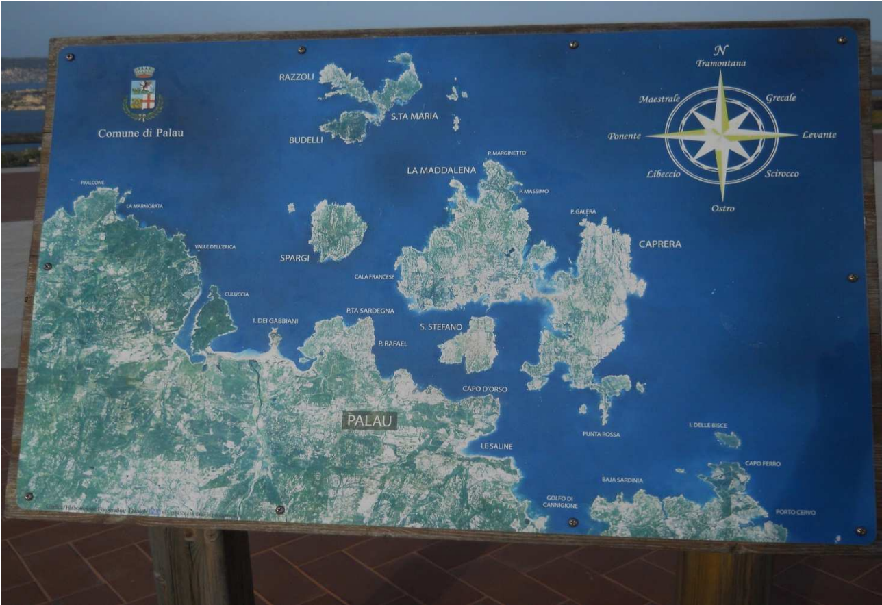
06/10/2015 La Maddalena cartina dell'omonimo arcipelago