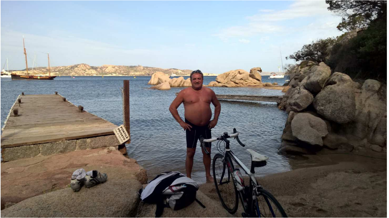
06/10/2015 Port Raphael ..... e Majur