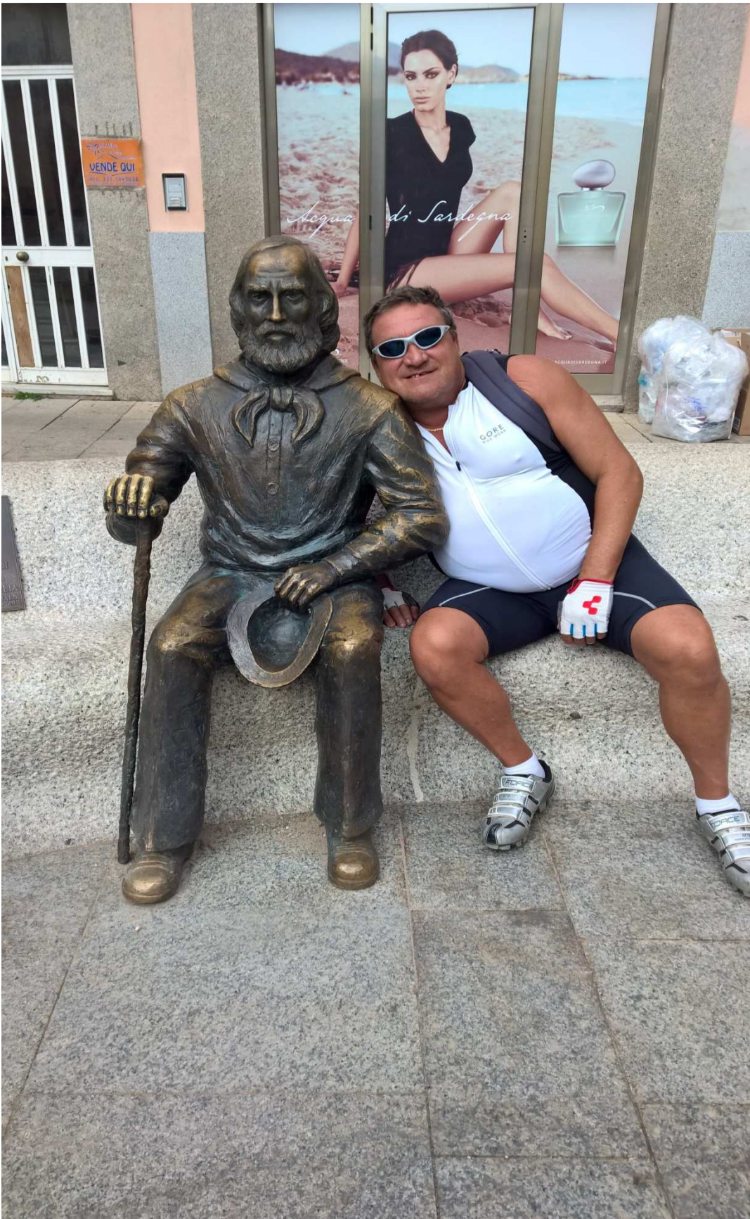
06/10/2015 Isola La Maddalena ..... foto ricordo con Garibaldi