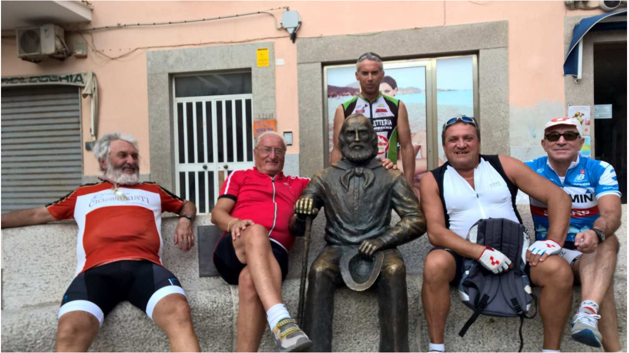
06/10/2015 Isola La Maddalena ..... foto ricordo con Garibaldi