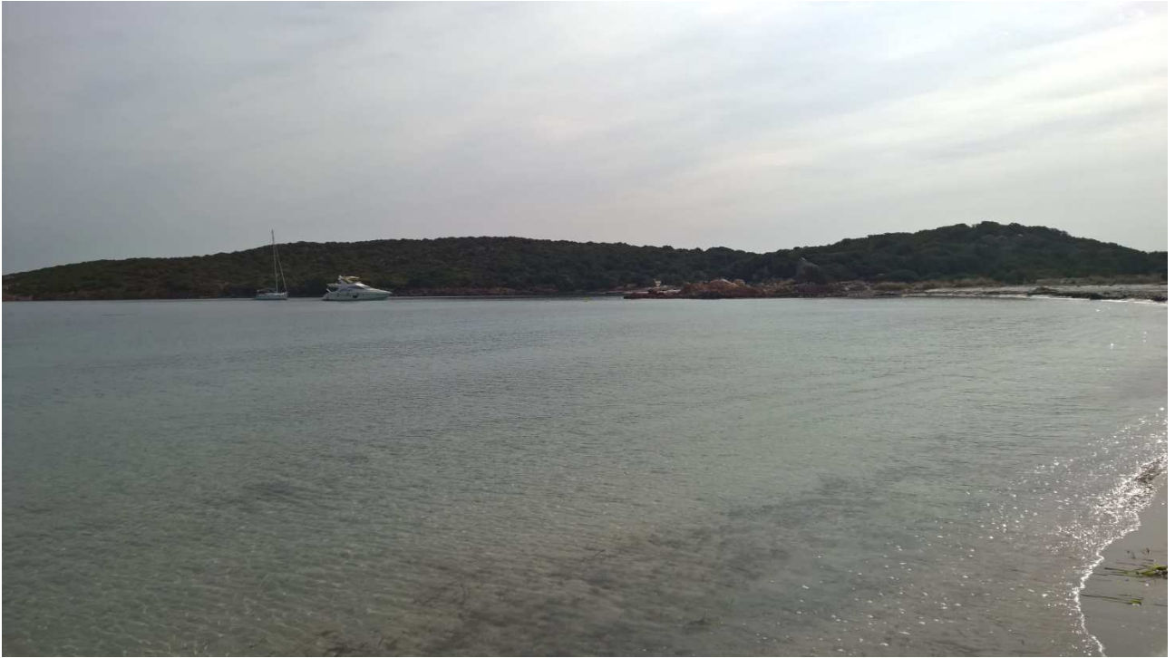
06/10/2015 Isola di Capriera ..... una delle sue spiagge