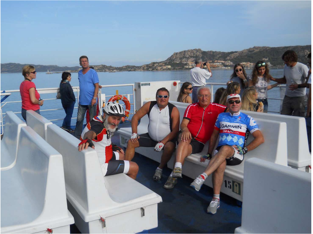
06/10/2015 Palau ..... NOI sul traghetto in navigazione per la Maddalena