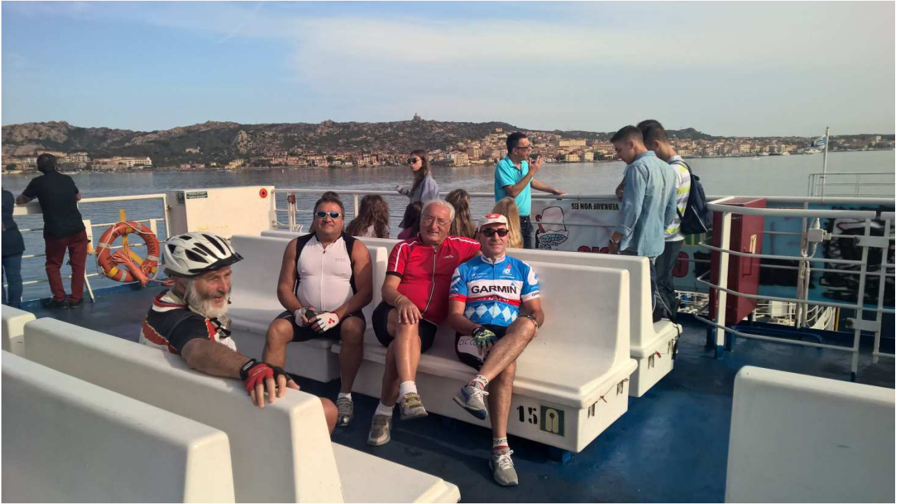
06/10/2015 Palau ..... NOI sul traghetto in navigazione per la Maddalena