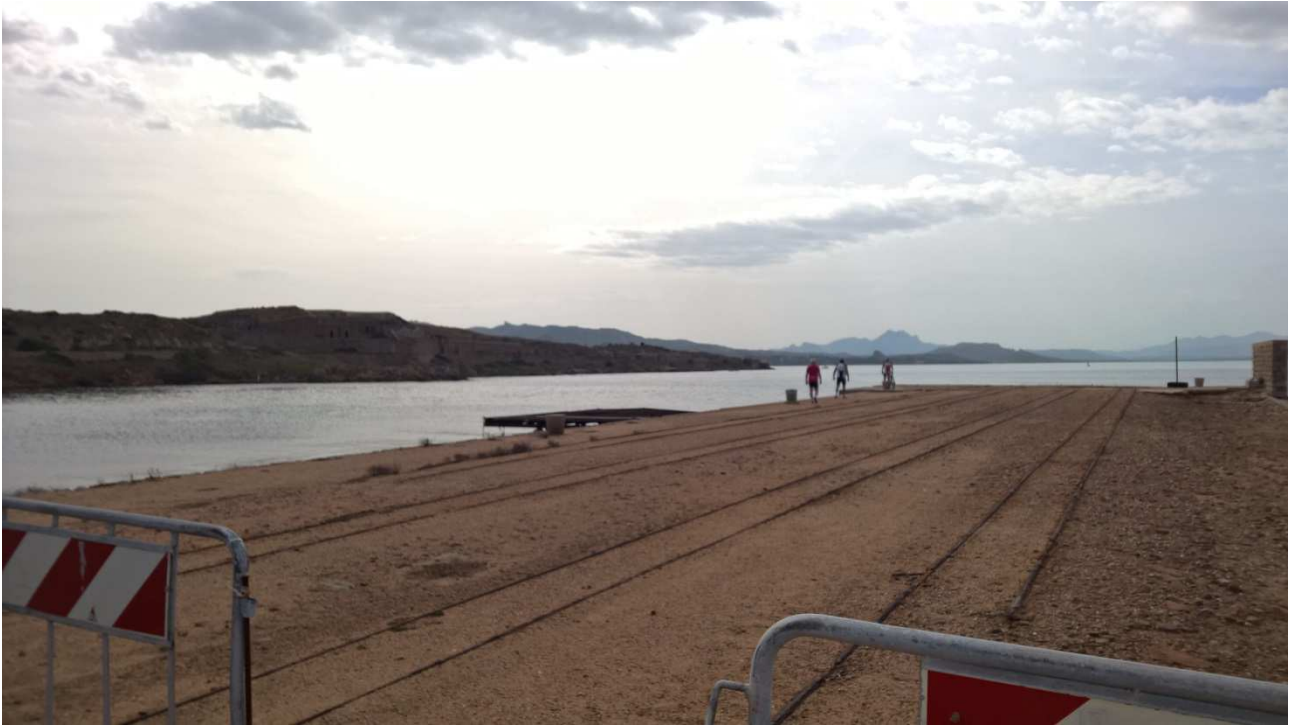
06/10/2015 Isola di Caprera ..... una vecchia miniera