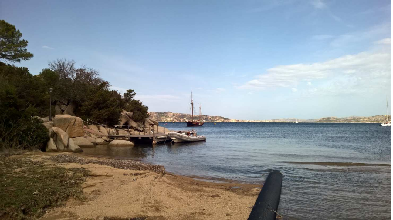
06/10/2015 Port Raphael