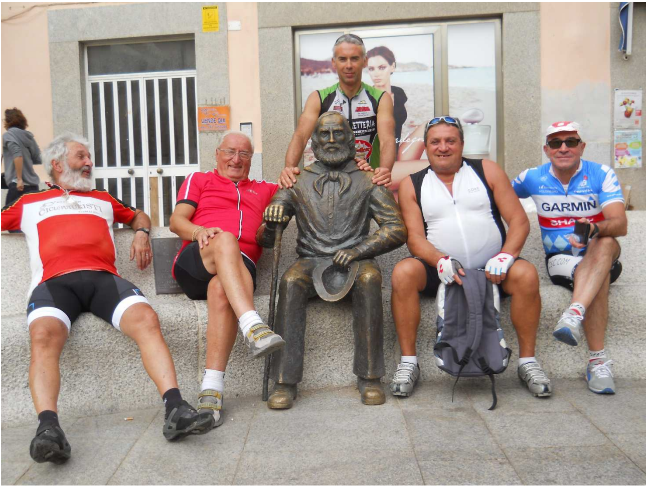
06/10/2015 Isola La Maddalena ..... foto ricordo con Garibaldi