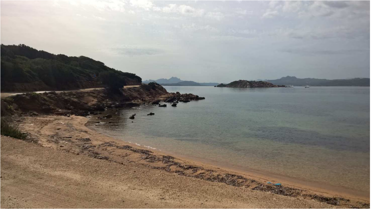
06/10/2015 Isola di Caprera ..... una delle sue spiagge