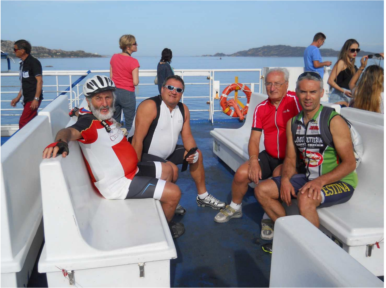
06/10/2015 Palau ..... NOI sul traghetto in navigazione per la Maddalena