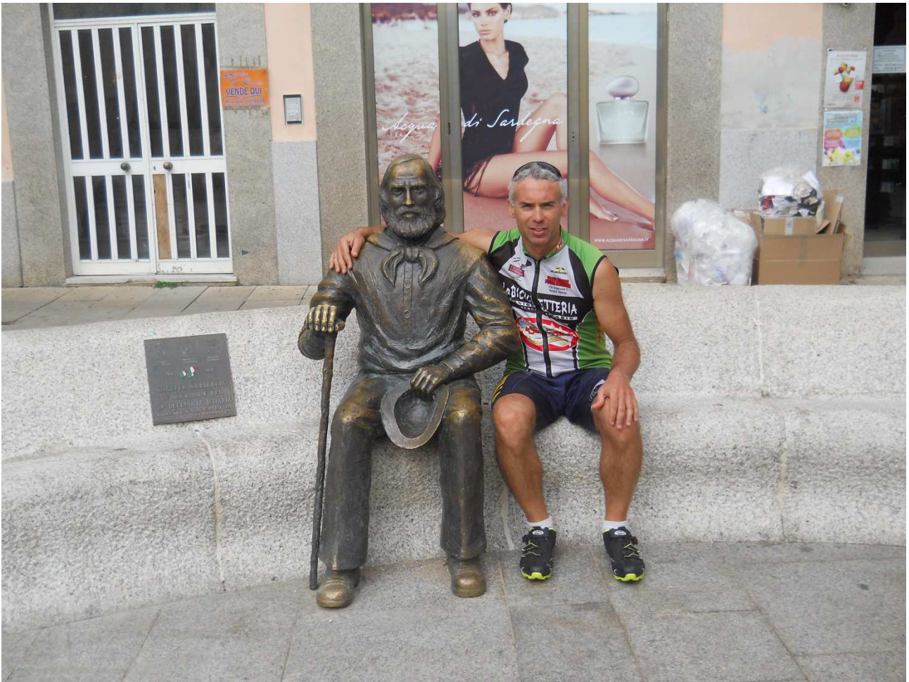
06/10/2015 Isola La Maddalena ..... foto ricordo con Garibaldi