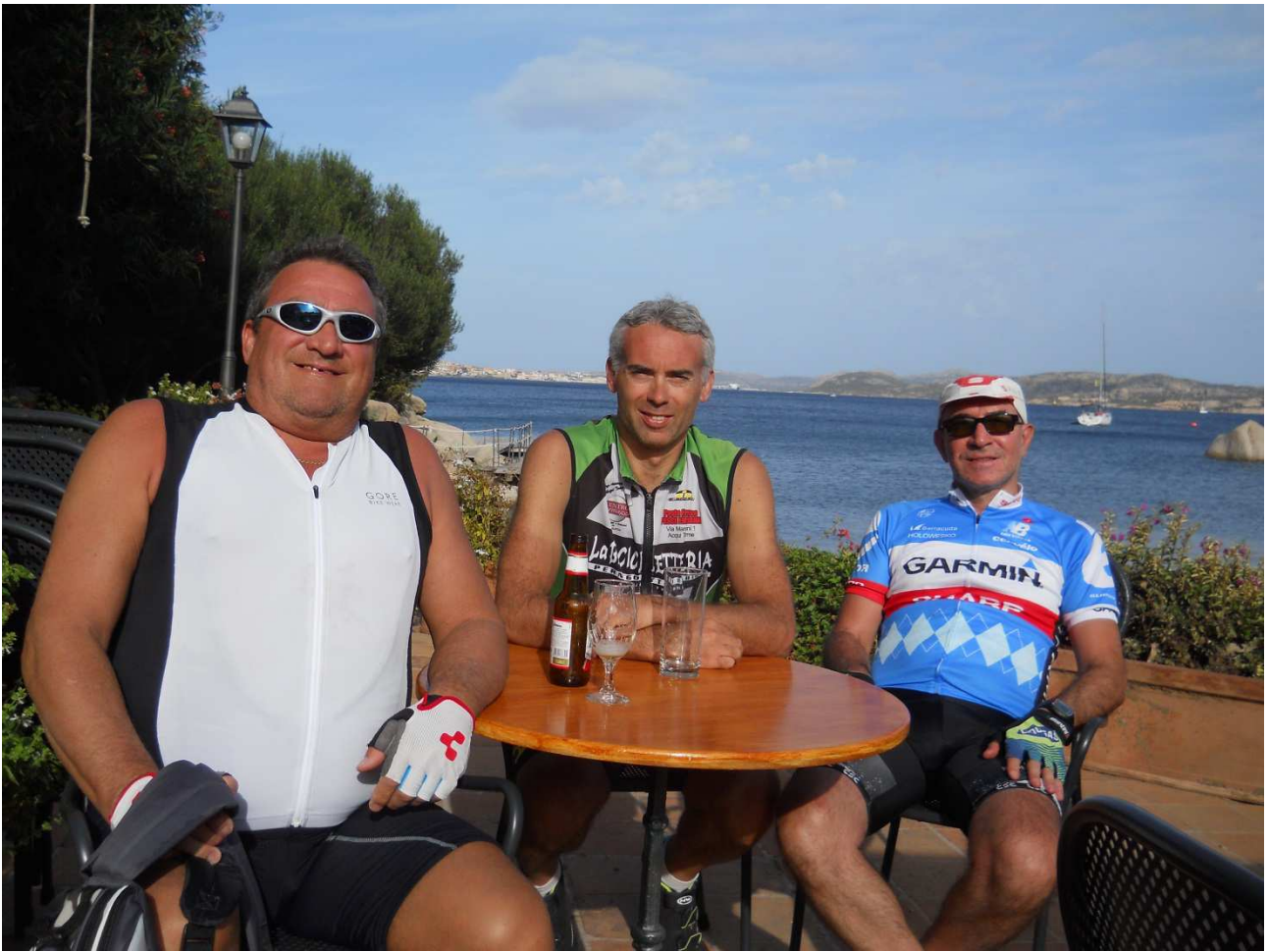
06/10/2015 Port Raphael ..... una birra con foto ricordo