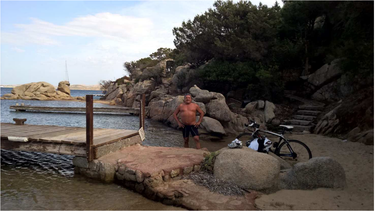
06/10/2015 Port Raphael ..... e Majur