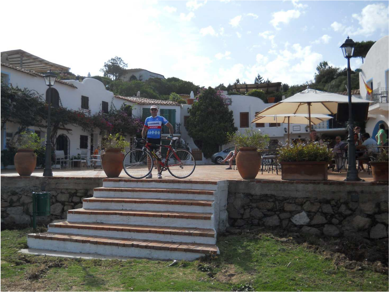
06/10/2015 Port Raphael