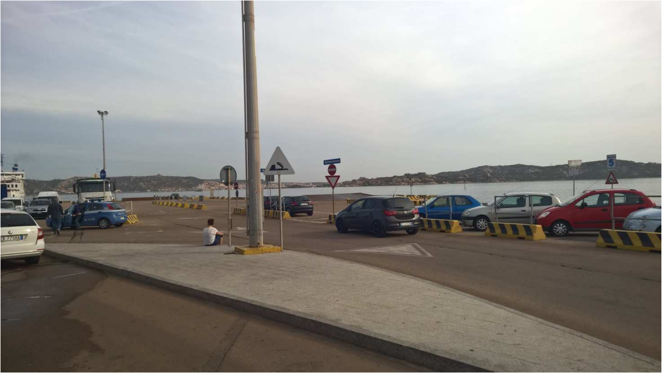
06/10/2015 Palau ..... porticciolo dove ci imbarcheremo per la Maddalena e Caprera