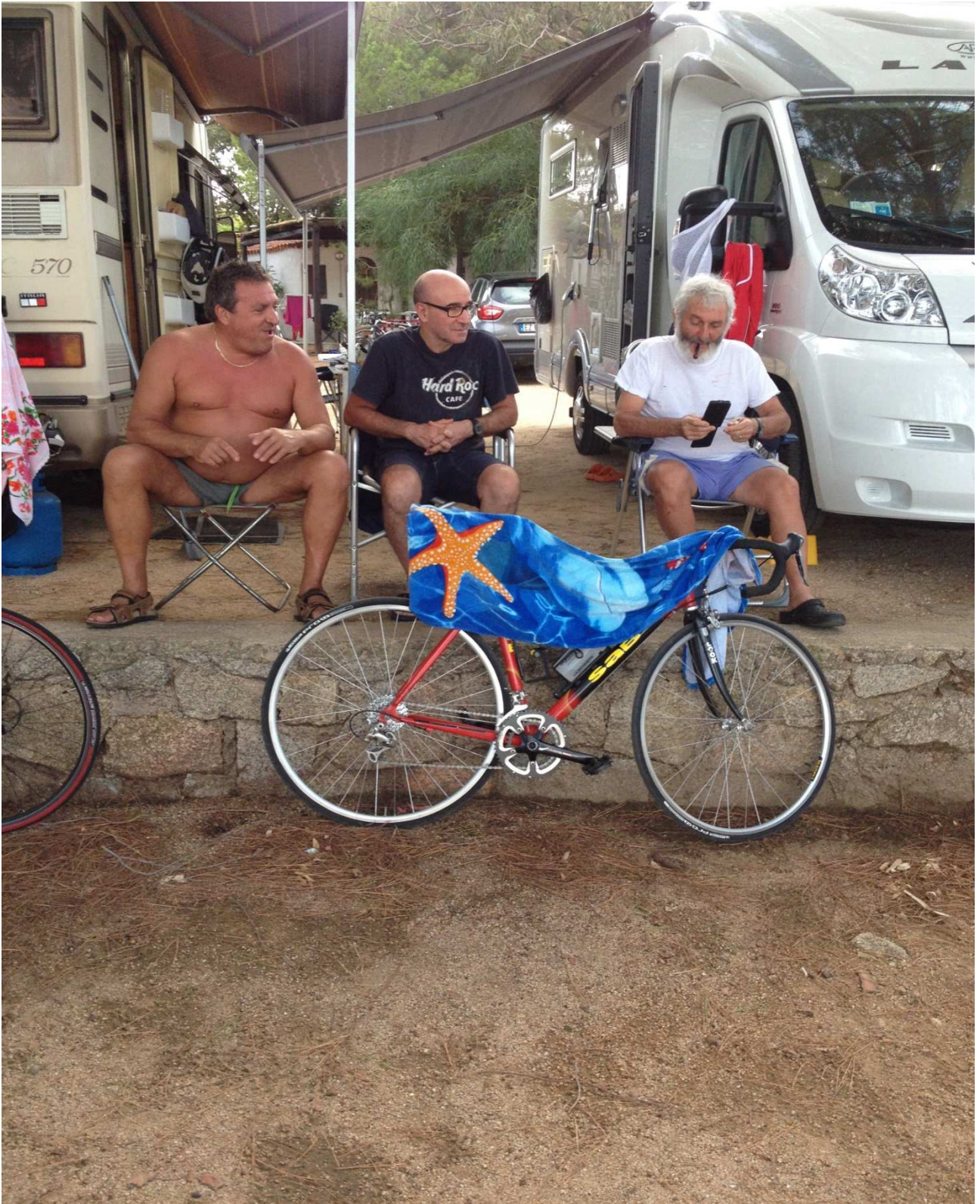
06/10/2015 In campeggio ..... relax dopo la bellissima giornata