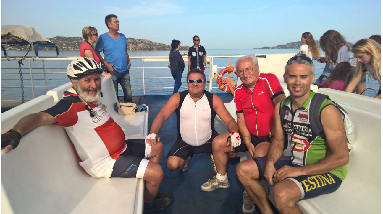
06/10/2015 Palau ..... NOI sul traghetto in partenza per la Maddalena