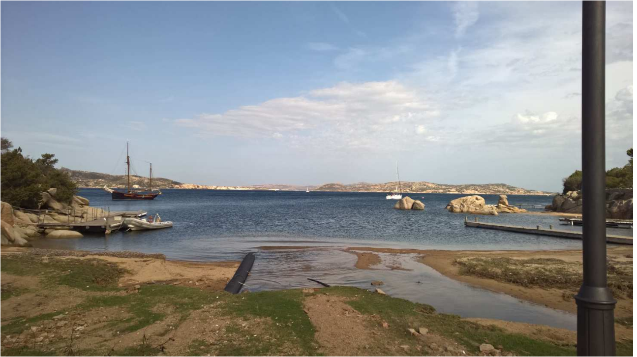
06/10/2015 Port Raphael