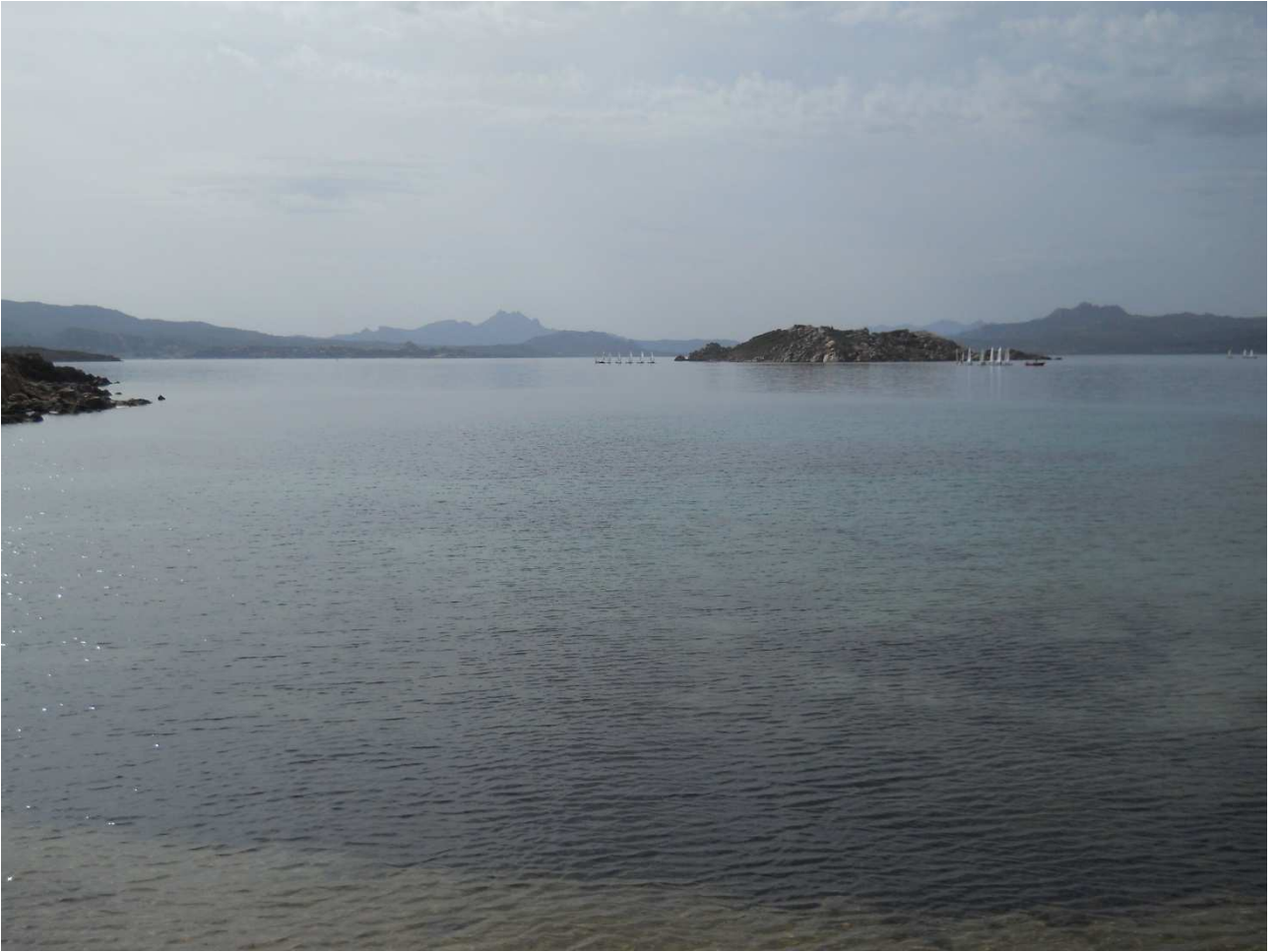
06/10/2015 Isola di Caprera ..... una delle sue spiagge