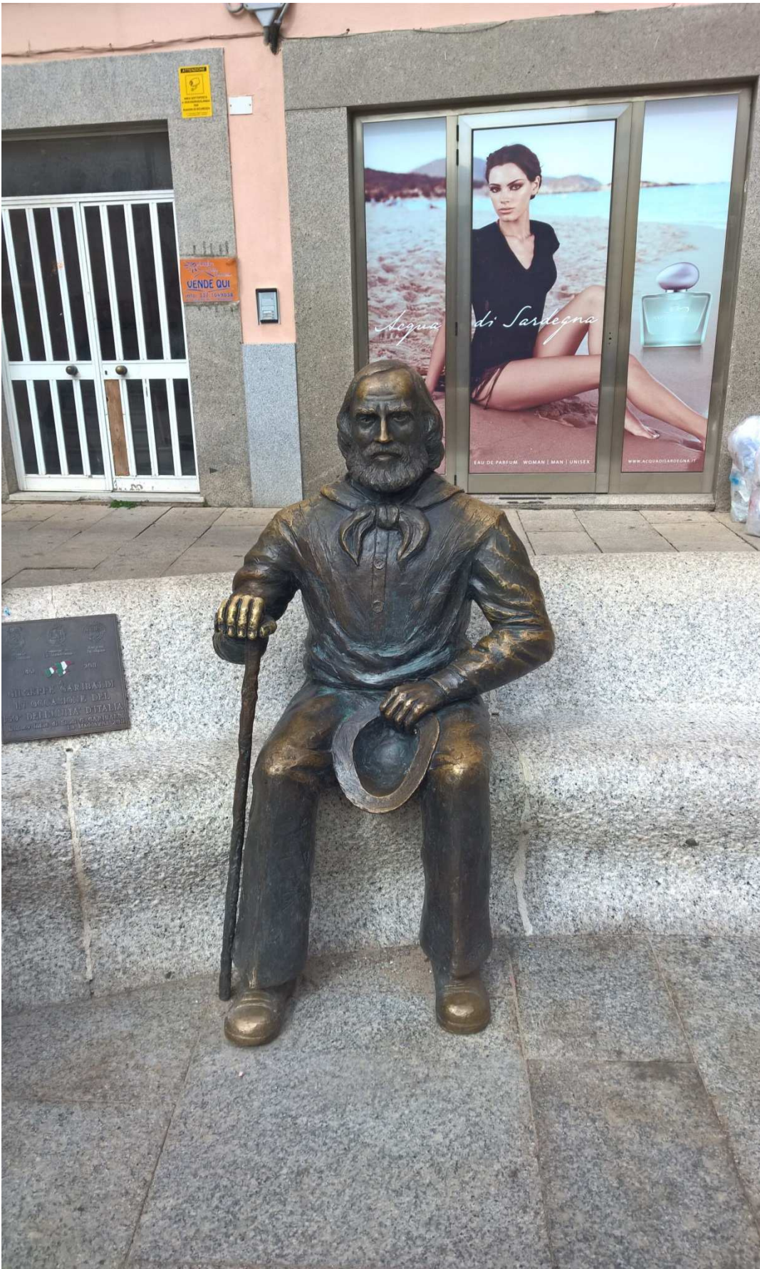
06/10/2015 Isola La Maddalena ..... Garibaldi è quello col bastone