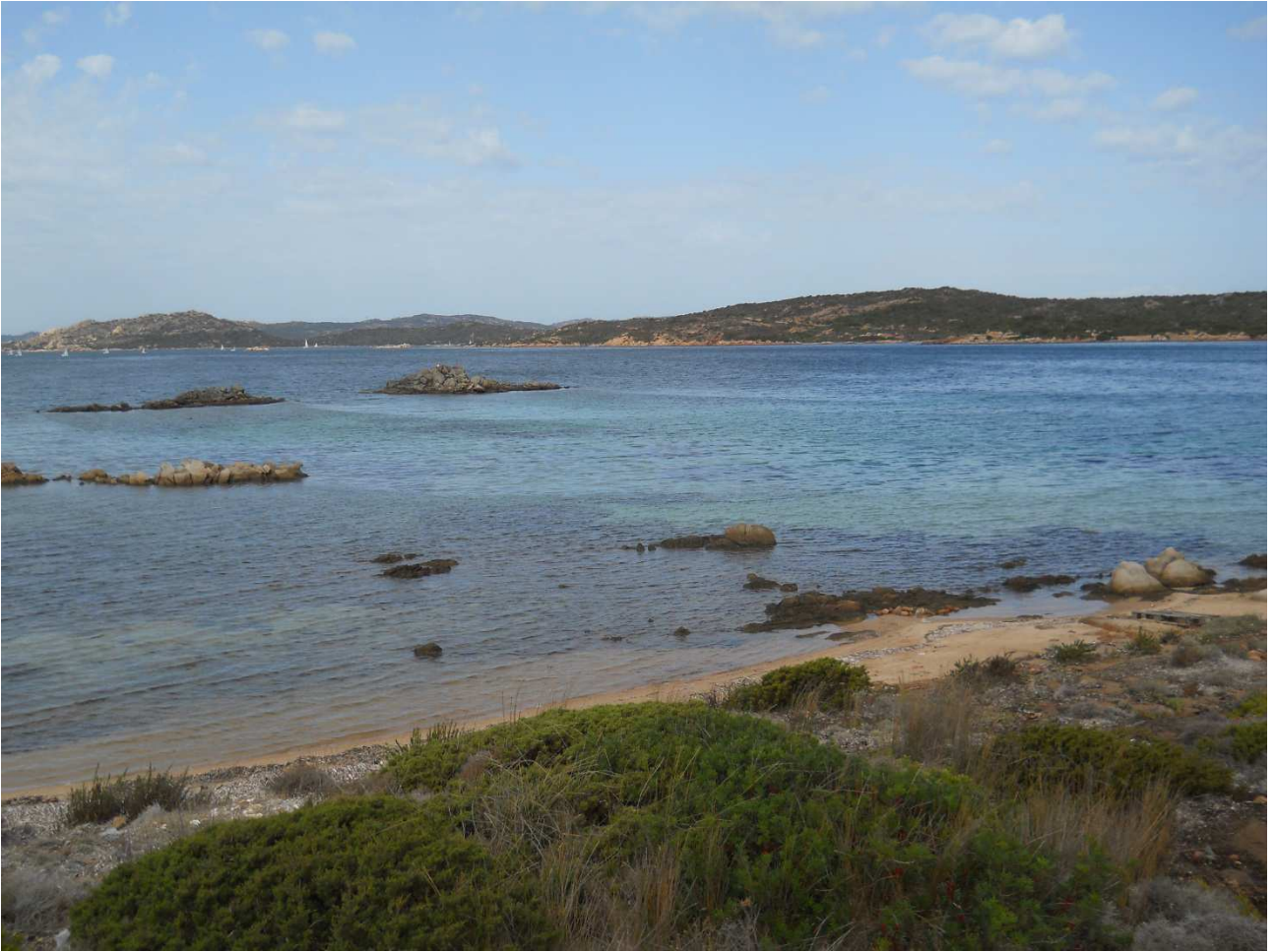
06/10/2015 Isola di Caprera ..... e i suoi angoli di paradiso