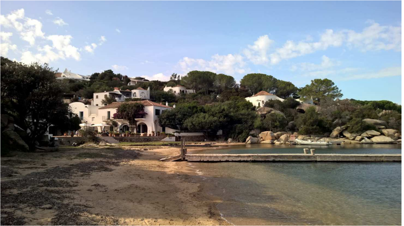
06/10/2015 Port Raphael