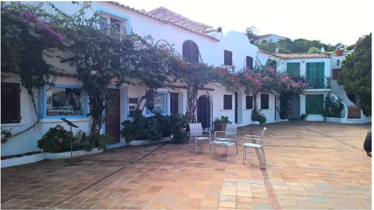
06/10/2015 Port Raphael