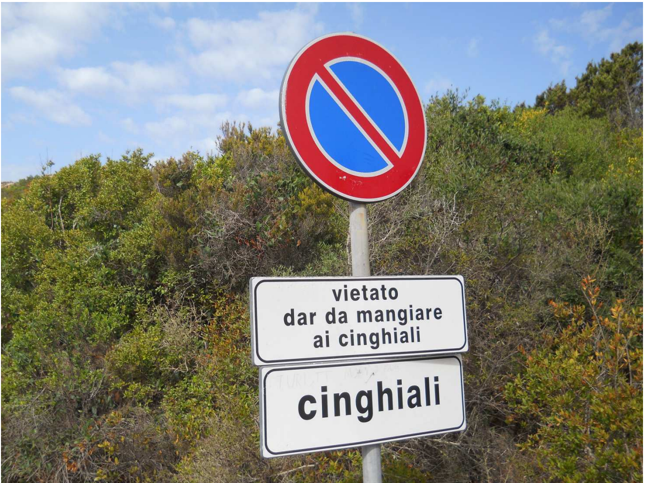
06/10/2015 Isola di Caprera ..... una segnaletica .... inconsueta