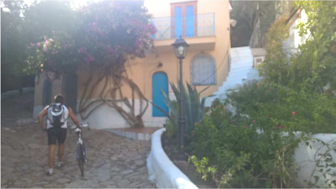
06/10/2015 Port Raphael ..... Majur si incammina per lasciarlo