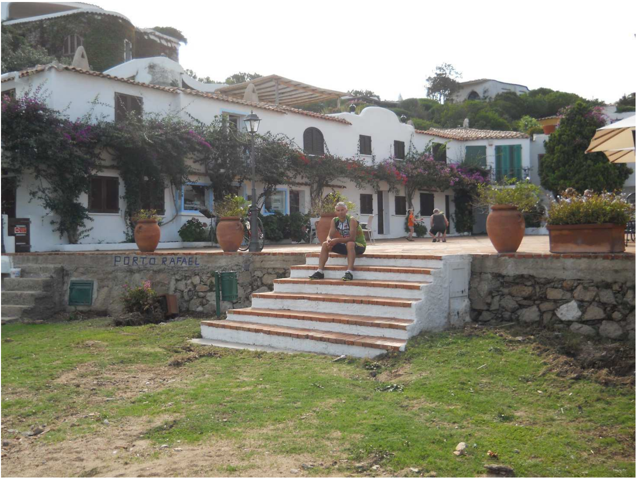
06/10/2015 Port Raphael