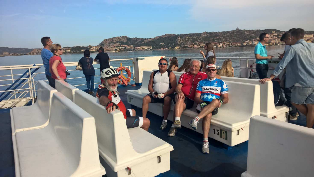
06/10/2015 Palau ..... NOI sul traghetto in navigazione per la Maddalena