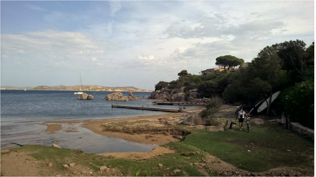
06/10/2015 Port Raphael